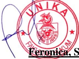
Feronica, S.H., M.H. Kaprodi S1 Hukum