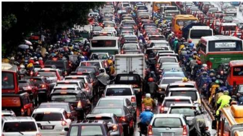
Gambar I. Kemacetan Jakarta