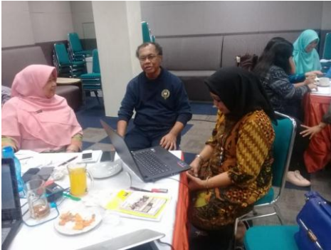
Konsultasi dengan narasumber