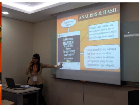
Presentasi salah satu pemakalah sesi paralel