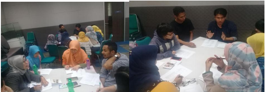
Praktek mengumpulkan data dari penutur jati dalam kelompok

Pelatihan ini dihadiri oleh 26 orang peserta yang berasal dari berbagai universitas di Indonesia, antara lain Universitas Gajah Mada (Yogyakarta), Universitas Bina Darma (Palembang), Politeknik Negeri Medan, IAIN Palangkaraya, Universitas Brawijaya (Malang), dan Universitas Andalas (Padang). Banyak peserta yang mengusulkan agar PKBB menyelenggarakan pelatihan linguistik lanjutan.