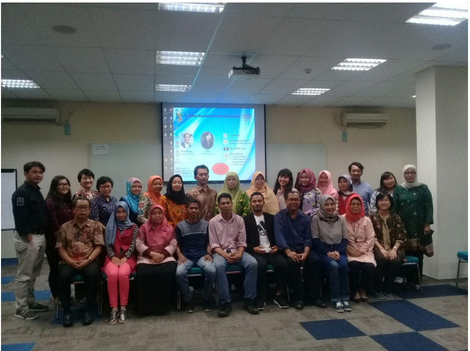
Foto para peserta pelatihan bersama narasumber dan informan bahasa