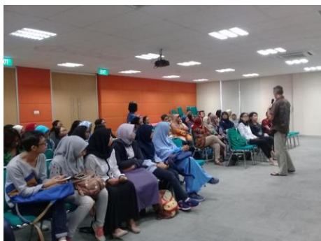
Sesi tanya jawab dengan peserta

Universitas Indraprasta PGRI, Universitas Al Azhar, ABA BSI Jakarta, Pusat Pengembangan dan Pemberdayaan Pendidik dan Tenaga Kependidikan Bahasa Kemdikbud (P4TK), Universitas Esa Unggul, dan STBA JIA (Bekasi).