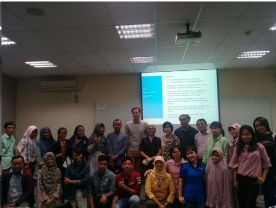
Foto bersama peserta dan pembicara