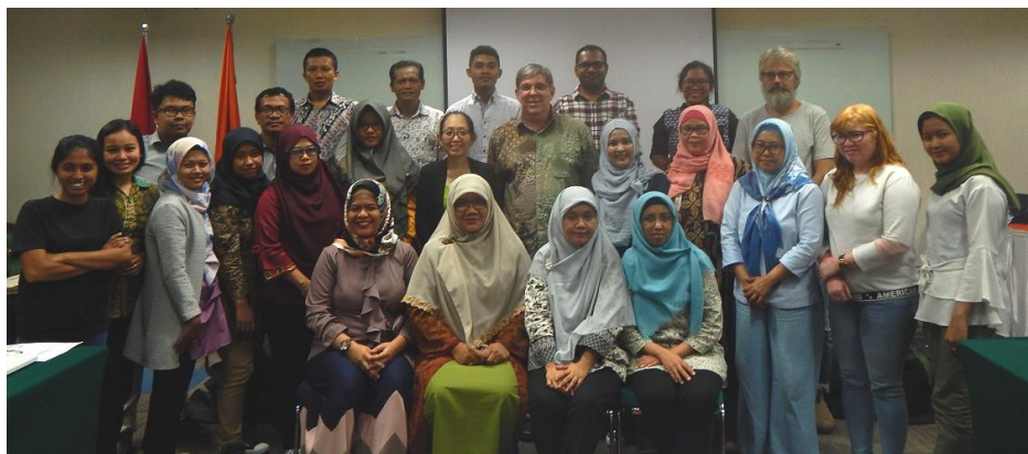
Foto bersama peserta dan narasumber