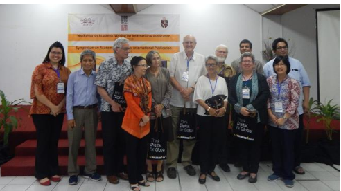
Foto bersama narasumber