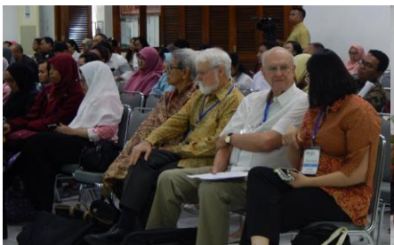
Peserta dan narasumber kegiatan