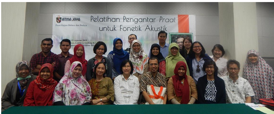
Sesi foto bersama