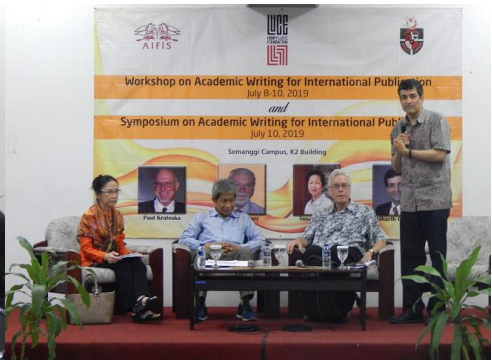
Sesi dengan narasumber