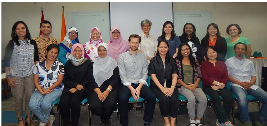
Foto bersama narasumber dan para peserta