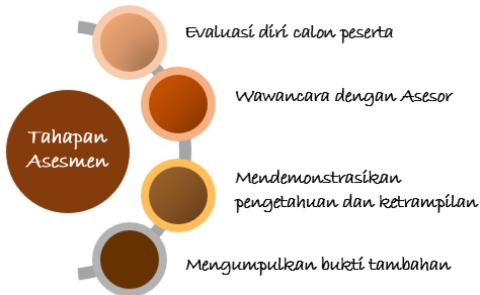
Gambar 2: Tahapan Asesmen RPL

Dokumen dokumen portofolio ( Bukti ) untuk mendukung klaim calon atas pernyataan kriteria capaian pembelajaran mata kuliah atau modul pembelajaran yang dilampirkan calon pada saat mengajukan lamaran akan diverifikasi dan divalidasi oleh Asesor sesuai prinsip bukti, yaitu, sah, cukup, terkini dan otentik.