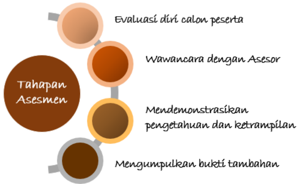
Gambar 2: Tahapan Asesmen RPL

Setelah formulir evaluasi diri dan Bukti selesai diverifikasi dan divalidasi oleh asesor, maka jika hasil evaluasi calon tersebut menunjukkan potensi untuk dapat mengikuti/direkognisi melalui RPL, maka pada tahap berikutnya adalah, calon diminta untuk mengikuti asesmen lanjut untuk memperoleh bukti lainnya.